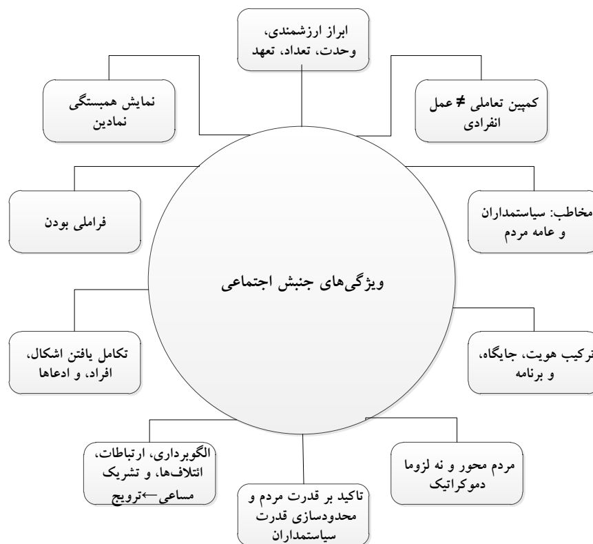
نمودار شماره ۱: ویژگی‌های جنبش اجتماعی

هر جنبش اجتماعی باید به نوعی ویژگی‌های ارزشمندی، وحدت، تعداد، و تعهد را نشان دهد. این ویژگی‌ها تعیین یافتن یک تظاهرات موفق و البته تأثیرگذار را مشخص می‌کند (تیلی، ۱۳۹۴: ۳۳۱). باید توجه داشت که ابراز این چهار ویژگی از اهمیت فراوانی برخوردار است زیرا حامل پیام‌های مهم سیاسی است و با دیگر ویژگی‌های خاص جنبش‌های اجتماعی همچون مشارکت‌جویان، بیانیه‌ها، مصاحبه‌های مطبوعاتی، جزوه‌ها، بستن روبانی با رنگ خاص و یا پوشیدن لباس‌های هم‌رنگ و هم‌سان، به‌کارگیری نمادها و نشان‌های خاص، اهتزاز پرچم، و یا حتی حضور ساده در جمعیت مرتبط است (polletta, 2002: 65). ابراز این چهار ویژگی ارتباط مستقیم با یکی دیگر از ویژگی‌های جنبش‌های اجتماعی دارد: ادعاهای مرتبط با هویت، جایگاه، و برنامه.