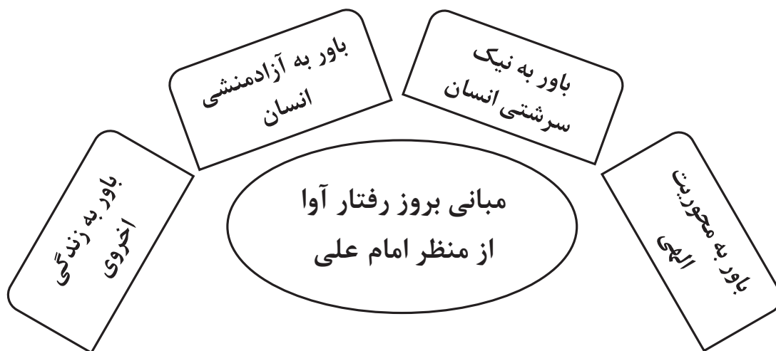
نمودار ۱. مبانی رفتار آوایی در نگرش علوی

مبانی رفتار آوایی به‌معنای مفروضات بنیادینی است که بروز رفتار آوا، تحت تأثیر آن قرار دارد. اینک مهم‌ترین باورهایی که در بروز رفتار آوایی اثرگذار است، براساس واکاوی گزاره‌های نهج‌البلاغه به شرح ذیل (نمودار ۱) دسته‌بندی می‌شود: