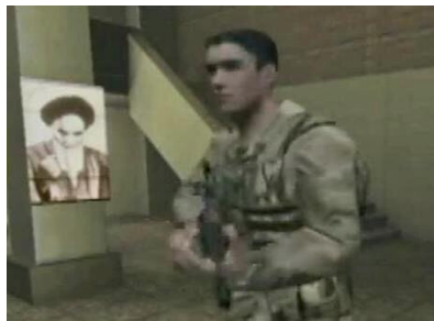
تصویر شماره ۱. محل انجام عملیات علیه تروریست‌ها با عکس امام خمینی در این مکان