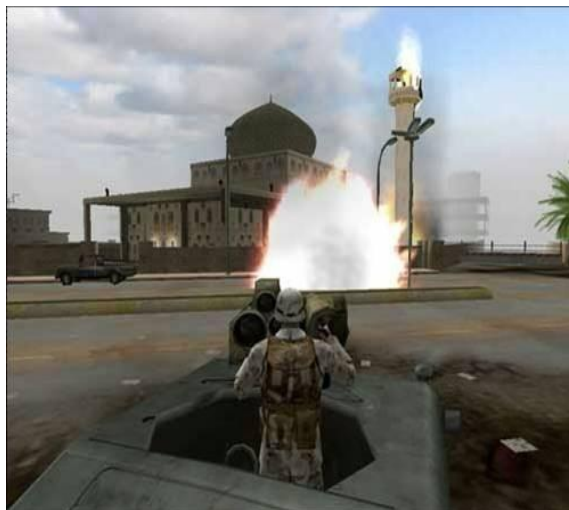
چارلز، قهرمان بازی، در حال موشک‌باران محل تروریست‌ها که شبیه مسجد است