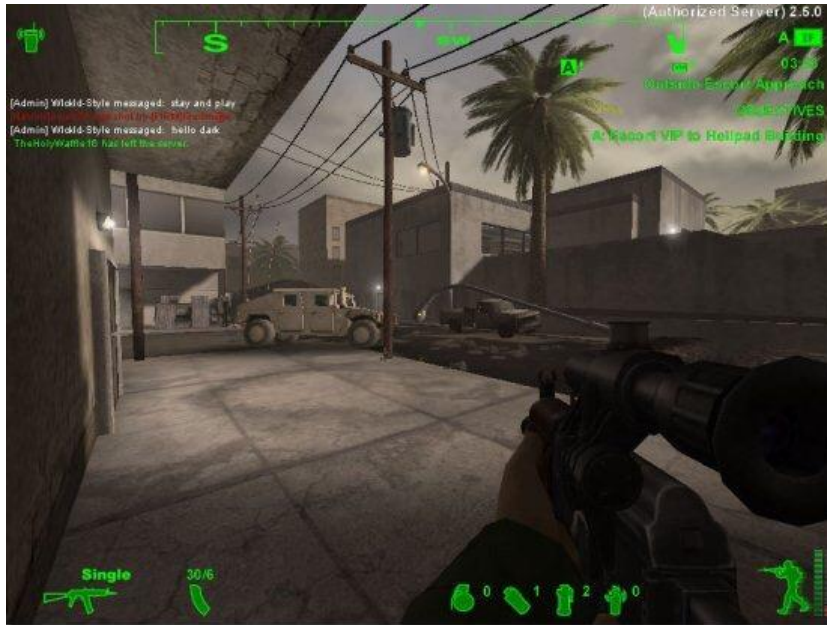
تصویر شماره ۸. جنگ علیه تروریست‌ها در مکانی شبیه کشورهای عربی

بازنمایی‌کننده جنگ بین آمریکا و کشورهای اسلامی که مورد حمایت روسیه هستند، می‌باشد.