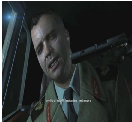
تصویر شماره ۶: سردار نیروی قدس که توسط سام گروگان گرفته شده است

گروه ستون چهارم از طریق سام با استفاده از ردیابی که در بمب‌های شیمیایی کار گذاشته است، اطلاع می‌یابد که بمب‌ها وارد شهر فیلادلفیا شده است. اعضای گروه مهندسان که بمب‌ها را به دست آورده‌اند، می‌خواهند طی عملیاتی تحت عنوان «آزادی در آمریکا» این بمب‌ها را در شهر فیلادلفیا منفجر کنند. سام و چارلز به نیروهای مهندسان حمله می‌کنند و بمب‌هایی شیمیایی را خنثی می‌کنند. چارلز متوجه می‌شود که یکی از افسران بلندپایه گروه مهندسان در این عملیات حضور دارد و در سیستم حمل و نقل آمریکا دست دارد.