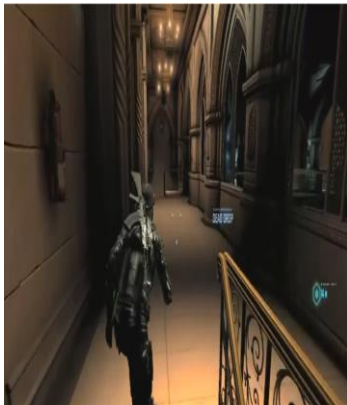
تصویر شماره ۷: نمایی از پایگاه نیروهای قدس که شبیه مسجد است